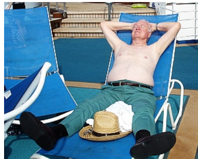
Senior: Gesundheitsgefahr durch zu wenig Sonne